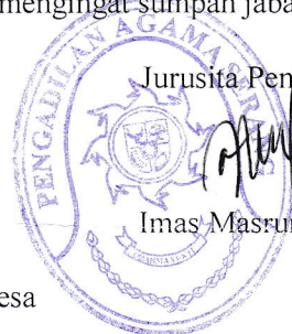
Imas Masruroh, SE